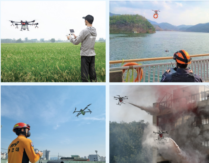
사진출처 : 좌-하) 신아일보, 2022.05.26 구리소방서, 소방드론 활용 특별구조훈련 추진 우-상) 전북도민일보, 2021.12.21 전주덕진소방, 소방드론 배치...인명구조 훈련 우-하) 경향신문, 2021.09.09 사다리차도 안 달는 '고층 화재'...이젠 '드론 소방수'에게 맡겨라