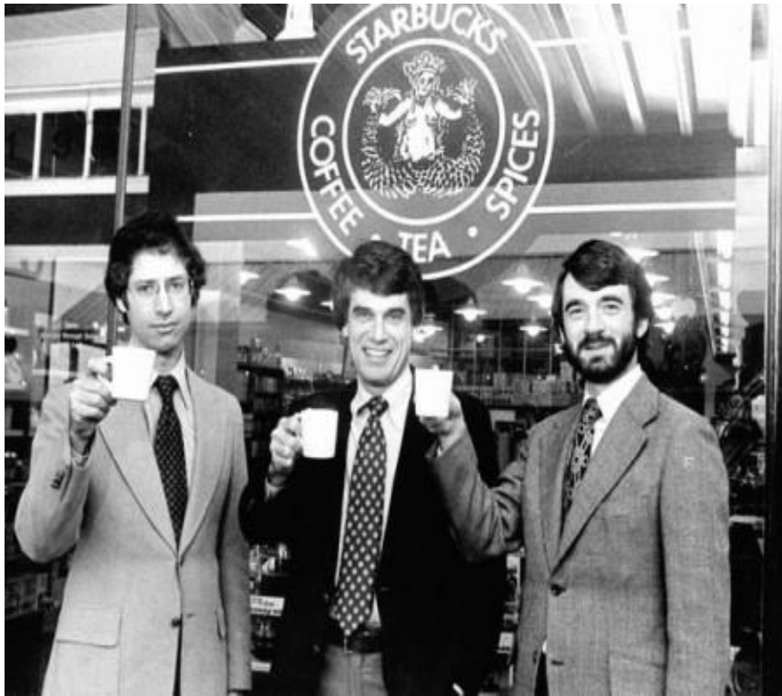
스타벅스의 창업자들

커피 애호가였던 스타벅스의 창업주 3명은 커피를 공유하는 모임을 가지던 중, 직접 고급 아라비카 원두 판매점을 운영하기로 하여 1971년 시애틀의 지역 시장인 파이크 플레이스 마켓에 원두, 차잎, 향신료를 판매하는 스타벅스 커피, 티&스파이스를 오픈함