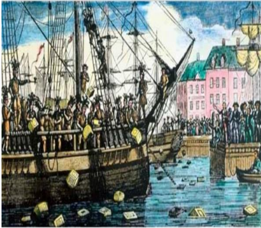
보스턴 티 파티

당시 미국은 영국의 식민지로 영국 본토 못지않게 차를 즐겨 마시는 문화가 있었음