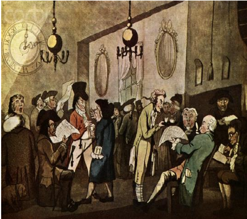
로이드 커피하우스, 자료: 서울경제

당시 유럽의 커피하우스는 커피를 마시는 공간으로써의 목적보다 신문을 읽거나 토론을 하는 목적으로 지식인들이 즐겨 찾는 공간으로 사용이 됨