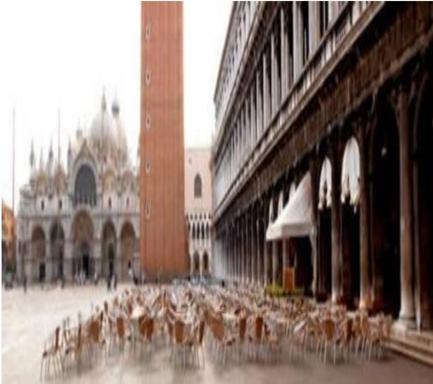
카페 플로리안의 전경

1615년 베니스의 무역상들에 의해 커피가 유럽에 소개된 후 유럽에 빠르게 전파됨