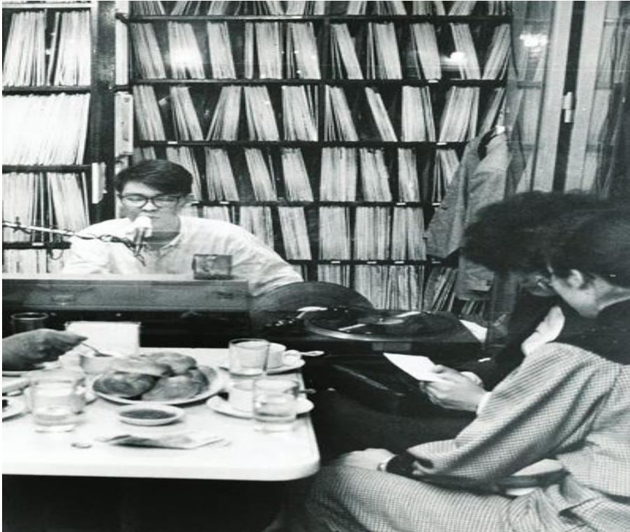
음악다방의 DJ

1970년대 인스턴트 커피의 보급과 함께 커피 자판기가 등장하여 다방의 입지가 줄어들게 됨