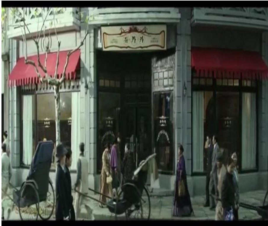
영화 밀정(2016)에 나온 카카듀의 전경

1920년대, 우리나라에 다방문화가 전파되어 유행되기 시작했으며, 대부분 일본인들이 운영함