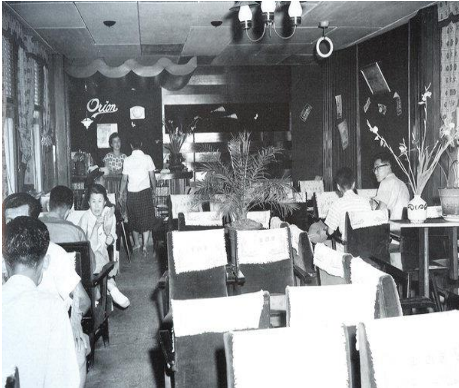
1961년 오리온다방, 자료:국제신문

1950년 6.25전쟁으로 주둔하게 된 미군에 의해 인스턴트 커피가 시중에 유통되며 모든 계층에 커피가 활발하게 공급됨