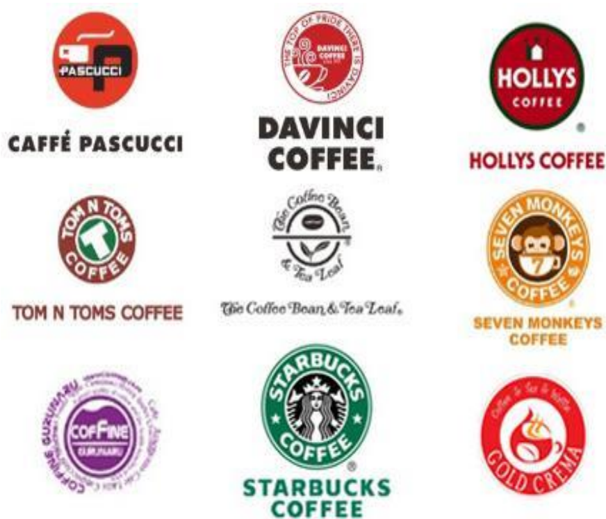
국내의 다양한 프랜차이즈 카페, 자료:소비자경제

에스프레소 커피의 대중화가 일어나며 국내 프랜차이즈 커피전문점이 크게 확산하기 시작함