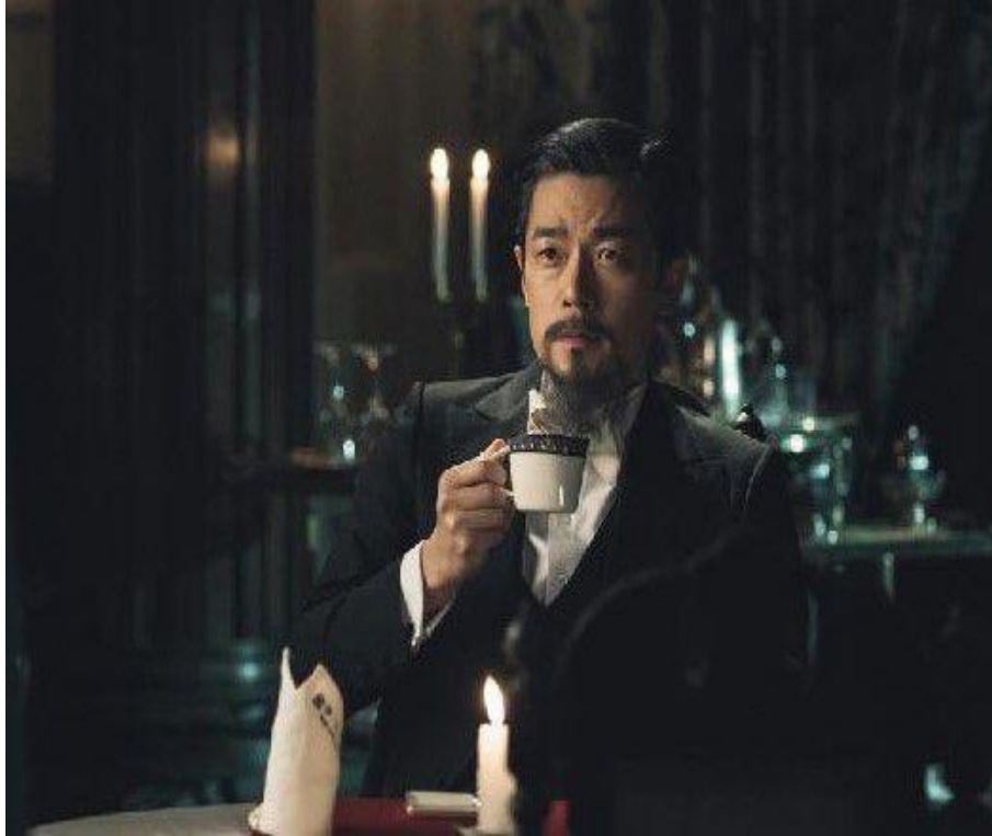
tvN드라마 미스터 션샤인(2018)에서 고종황제(이승준)가 커피를 마시는 장면, 자료:tvN

1896년 아관파천으로 고종황제가 러시아 공관으로 거처를 옮겨 그 곳에 머무를 때 러시아공사 웨베르(Waeber, K. 韋貝)를 통해 커피를 접하게 된 후 커피를 즐겨 마시게 됨