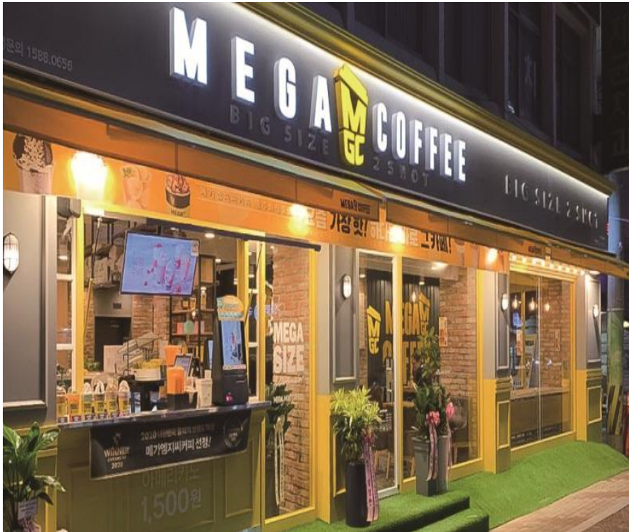
저가격의 커피전문점

값비싼 프랜차이즈 사이에서 가성비를 내세운 저가형 프랜차이즈들의 등장으로 커피시장이 양분화 됨