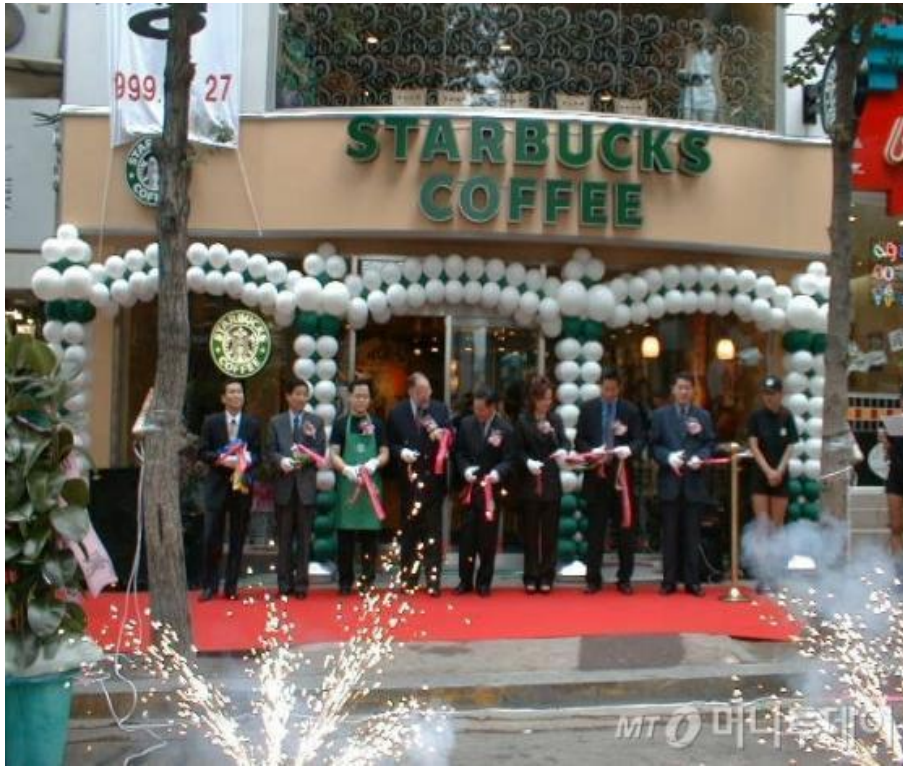
스타벅스 국내 1호점 개점행사

1999년 7월 이대 앞 스타벅스 1호 점이 문을 열며 본격적인 프랜차이즈 카페 시대가 도래하게 됨