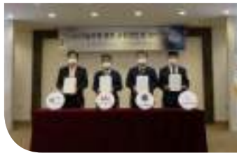
• 대통령직속 정책기획위원회 등 전문가관과 AI+x 인재양성 공동선언 ('21.5.12)