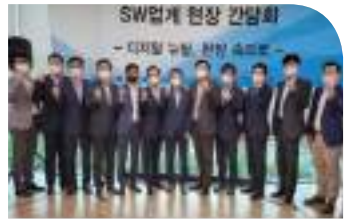
• 과학기술정보통신부 SW정책관 주재 우수SW육성 방안 협단체 간담회 ('21.5.20)