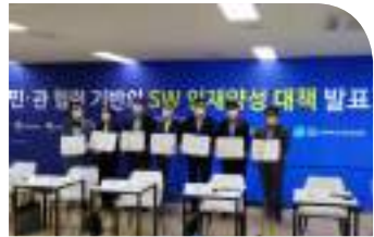
• 경제부총리 주재 민·관 협력기반의 소프트웨어 인재양성 대책 발표('21.6.9)