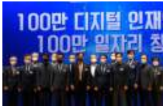
• 국회 스타트업 지원센터 주최 K-뉴딜 유니콘 포럼, 100만 디지털 인재 양성 발표('21.11.26)