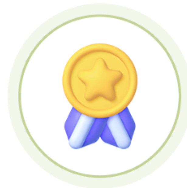
인성 인증 면접 뱃지