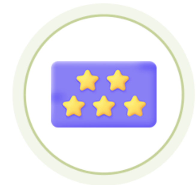
굿네이버스 채용 가산점