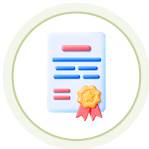
인성역량 강화과정 수료증