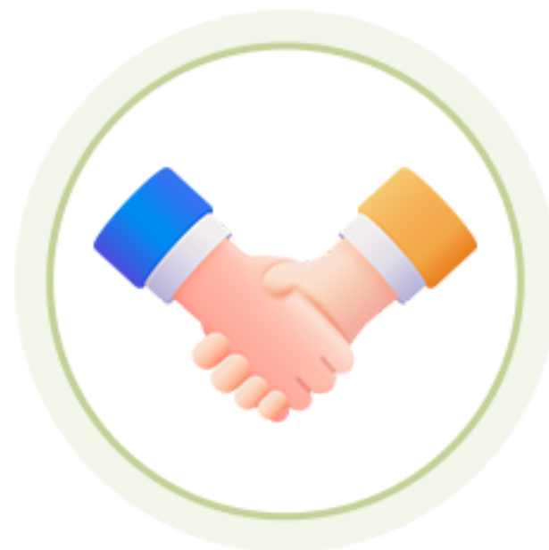
디자인씽킹 워크샵 참여 기회