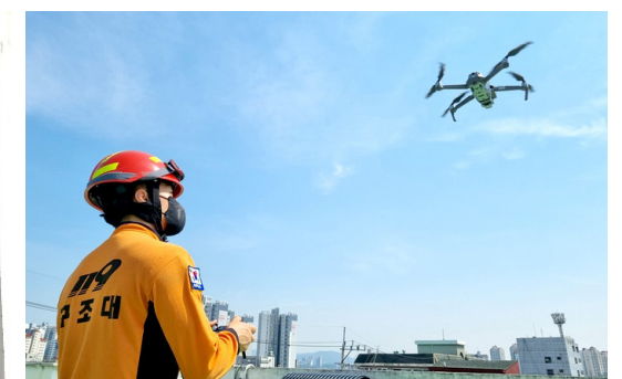
경향신문 | 2021.09. 사다리차 안 닿는 '고층 화재' 이젠 '드론 소방수'에게 맡겨라