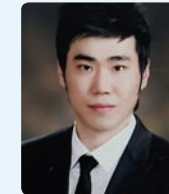
강남 정택권 지점장 2009. 9월 위촉 열정, 근성, 끼 그리고 올바른 인성을 가졌다면 문제없습니다.