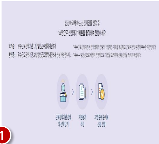
희망근로장학기관 신청 및 조회