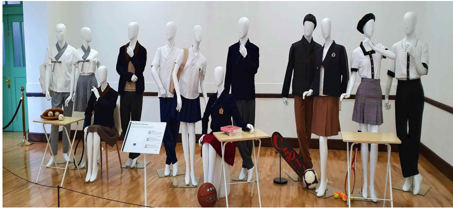
[별첨2] 2019 한복교복 디자인공모전 및 2019 한복교복 디자인프로젝트 주요 결과물 이미지